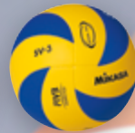
SV-3 UVP 34,95 € / S. 28