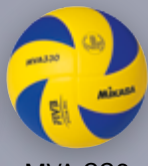
MVA 330 UVP 44,95 € / S. 21