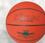
PERMALAST UVP 29,95 € / S. 56