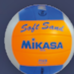
Soft Sand UVP 29,95 € / S. 41