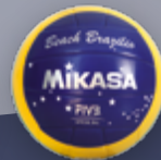
Beach Brazilio UVP 34,95 € / S. 45