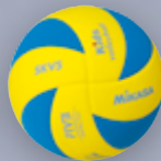
SKV5 Kids UVP 29,95 € / S. 27