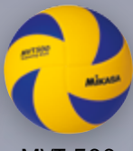
MVT 500 UVP 69,95 € / S. 22