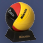
MVA 1,5 DE UVP 9,95 € / S. 24