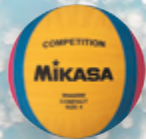
W6609W UVP 24,95 € / S. 50