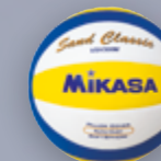
Sand Classic UVP 29,95 € / S. 37