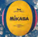
W6000W UVP 54,95 € / S. 49