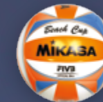
Beach Cup UVP 24,95 € / S. 38