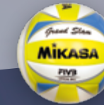
Grand Slam UVP 34,95 € / S. 38