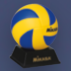
MVA 1,5 UVP 9,95 € / S. 24