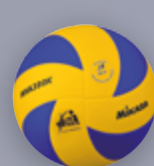
MVA 380K UVP 29,95 € / S. 15