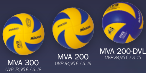
MVA 300 UVP 74,95 € / S. 19