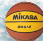
BR 512 UVP 19,95 € / S. 56