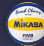
VXT 30 UVP 49,95 € / S. 37