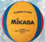
W6600W UVP 24,95 € / S. 50