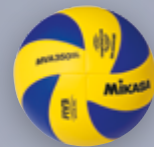
MVA 350 SL UVP 24,95 € / S. 28