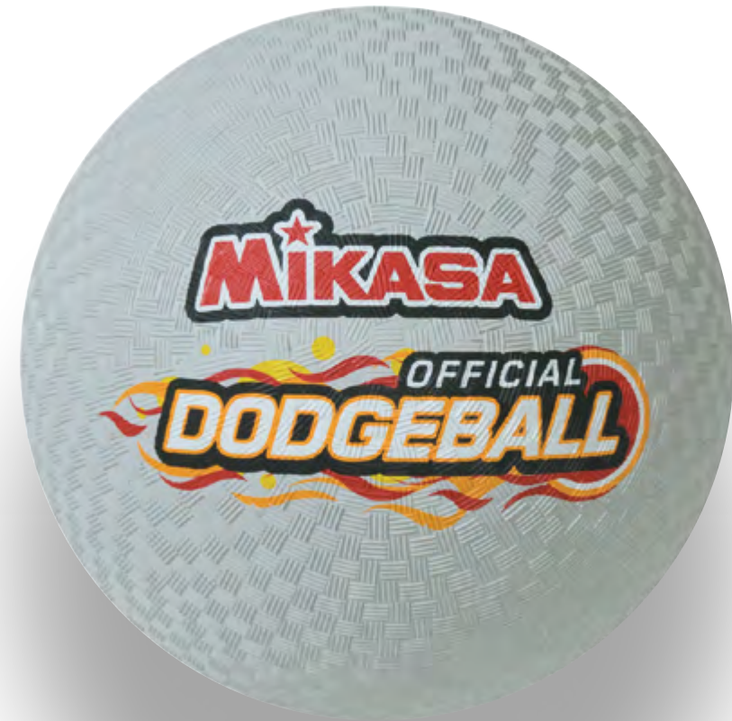
Foto: Dodgeball Beach-Cup