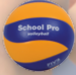
MVA 390 SCHOOL PRO UVP 34,95 € / S. 30