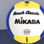
VXL 20 UVP 39,95 € / S. 41