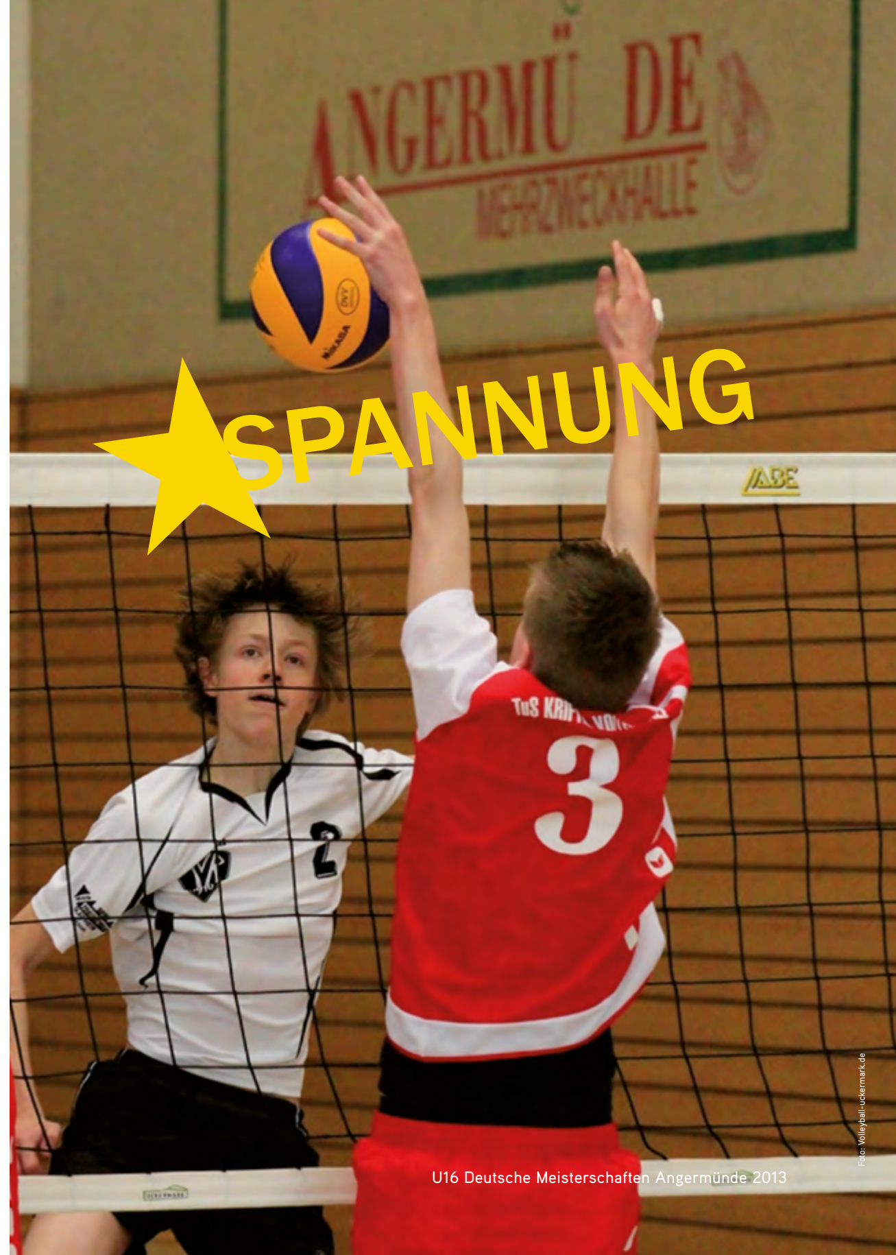
U16 Deutsche Meisterschaften Angermünde 2013