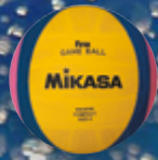
W6009W UVP 52,95 € / S. 49