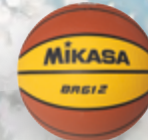
BR 612 UVP 19,95 € / S. 56