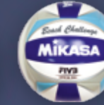
Beach Challenge UVP 29,95 € / S. 38