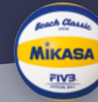
VX 30 UVP 39,95 € / S. 37