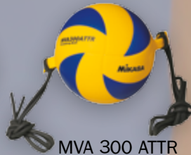
MVA 300 ATTR UVP 79,95 € / S. 22