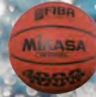
BQ1000 UVP 59,95 € / S. 55