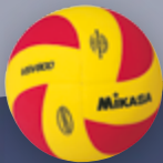
VSV 800 UVP 24,95 € / S. 21