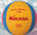
WTR6W UVP 24,95 € / S. 50