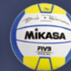
Brink-Reckermann L.E. UVP 29,95 € / S. 43