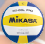
MG SCHOOL PRO UVP 39,95 € / S. 30