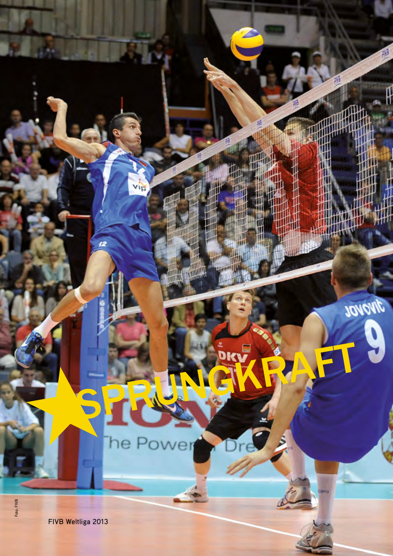
FIVB Weltliga 2013