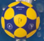
K5-IKF UVP 44,95 € / S. 59