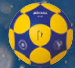
K4-IKF UVP 44,95 € / S. 59