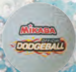
DGB 850 UVP 9,95 € / S. 61