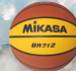
BR 712 UVP 19,95 € / S. 56