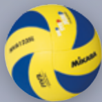
MVA 123 (SL) UVP 24,95 € / S. 27